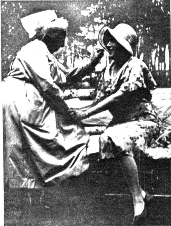
Lili Elbe im Park der „Staatlichen Frauenklinik“ zu Dresden zusammen mit der Frau Oberin im Juni 1930 Nach der Operation